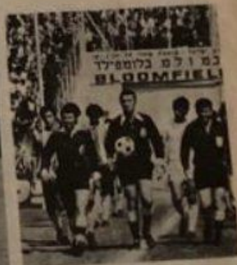
השופטים והדפוס לוח (בן 21, שאמר לאחר המשחק, נבחרו לשפוט את זה טובה לא היו בעיות). מולדך את סונו טיברת צבי (מימין) ואילאש אוסר בשמאחוריהם שערות הכדורגלנים כי החלה השבת הגדולה ב, בלוטפילד.

האמנים בתחילת המשחק בין שני טון לבית"ר תל-אביב. שני מלונטר שהמנהל המשותף שלהן העונה הוא בעצם יכולים להתאושש ממטבחים. נראו שני האמנים במסגרת ימי רוחות. אהרון כפישלוק של-שמשון (מימין) נגשים בכר המולד באהרן נה בהצלחה את בית"ר המבט ה- נעים כמו מעיד על מצבם הטוב של השנים.